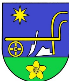
Erb obce Bogliarka